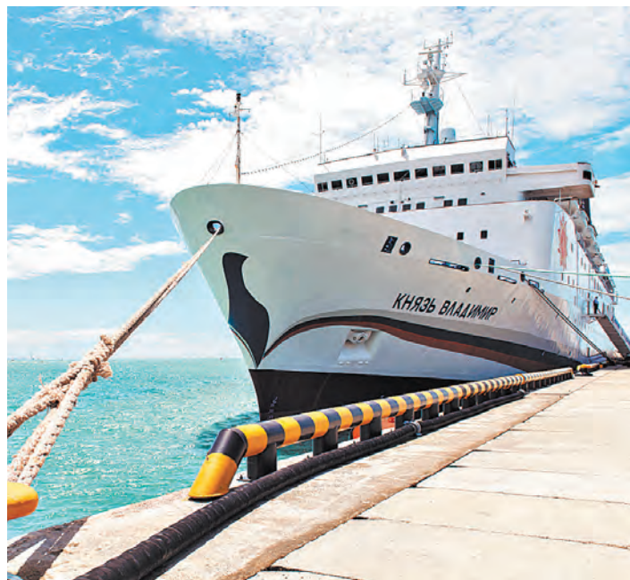
«Князь Владимир» построен в 1977 году, в 2005 году приведен в соответствие с современными требованиями, прошел реновацию в 2013 и 2017 годах.

Идея открыть регулярное морское сообщение между Сочи и крымскими курортами принадлежит президенту РФ, в прошлом году глава государства дал соответствующее распоряжение минтрансу. Для новой линии «Росморпорт» приобрел круизное судно Roj Star, позже переименованное в «Князь Владимир». Построен лайнер в 1977 году, в 2005 году приведен в соответствие с современными требованиями, прошел реновацию в 2013 и 2017 годах.