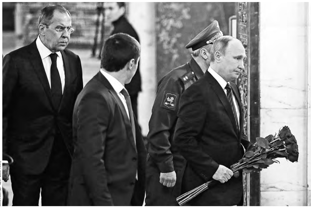
Владимир Путин пришел проститься с Андреем Карловым с букетом бордовых роз.