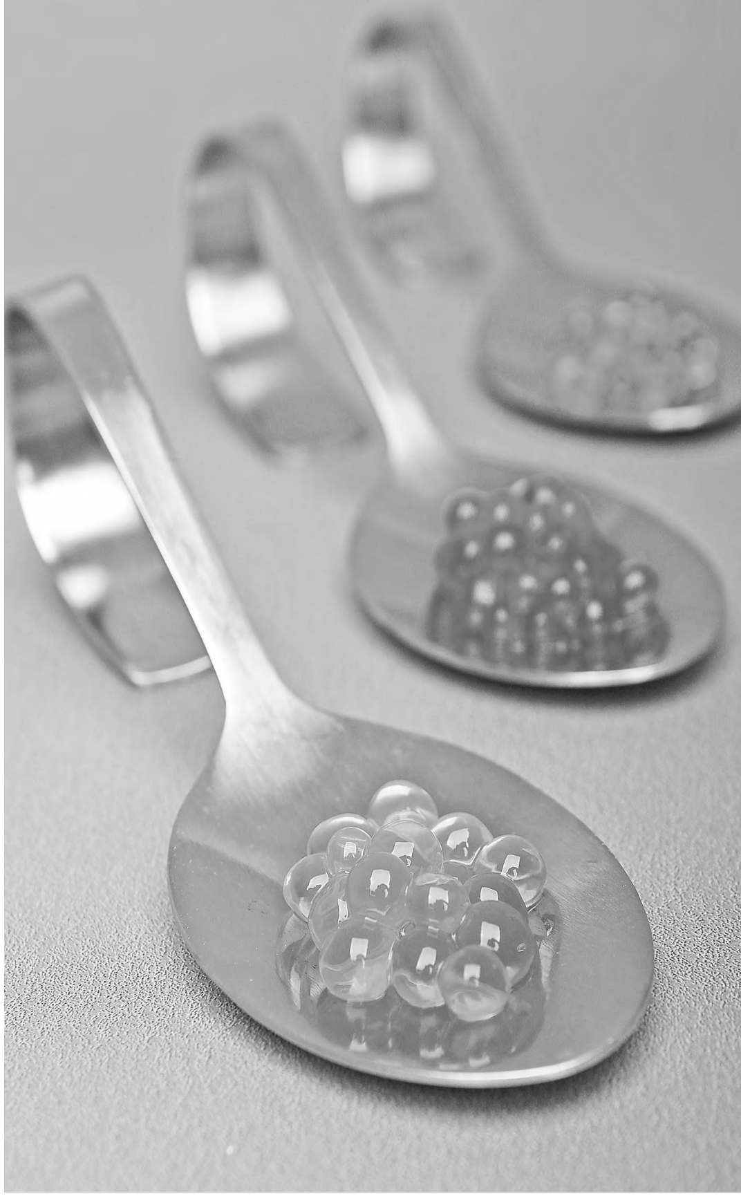
Россельхознадзор не смог проследить путь до прилавка 6 из 10 образцов черной икры в «самых ведущих магазинах».

Пока нигде не оговорено, сколько человек может вывезти. И как только мы стали внедрять электронную ветеринарную сертификацию и начали брать под