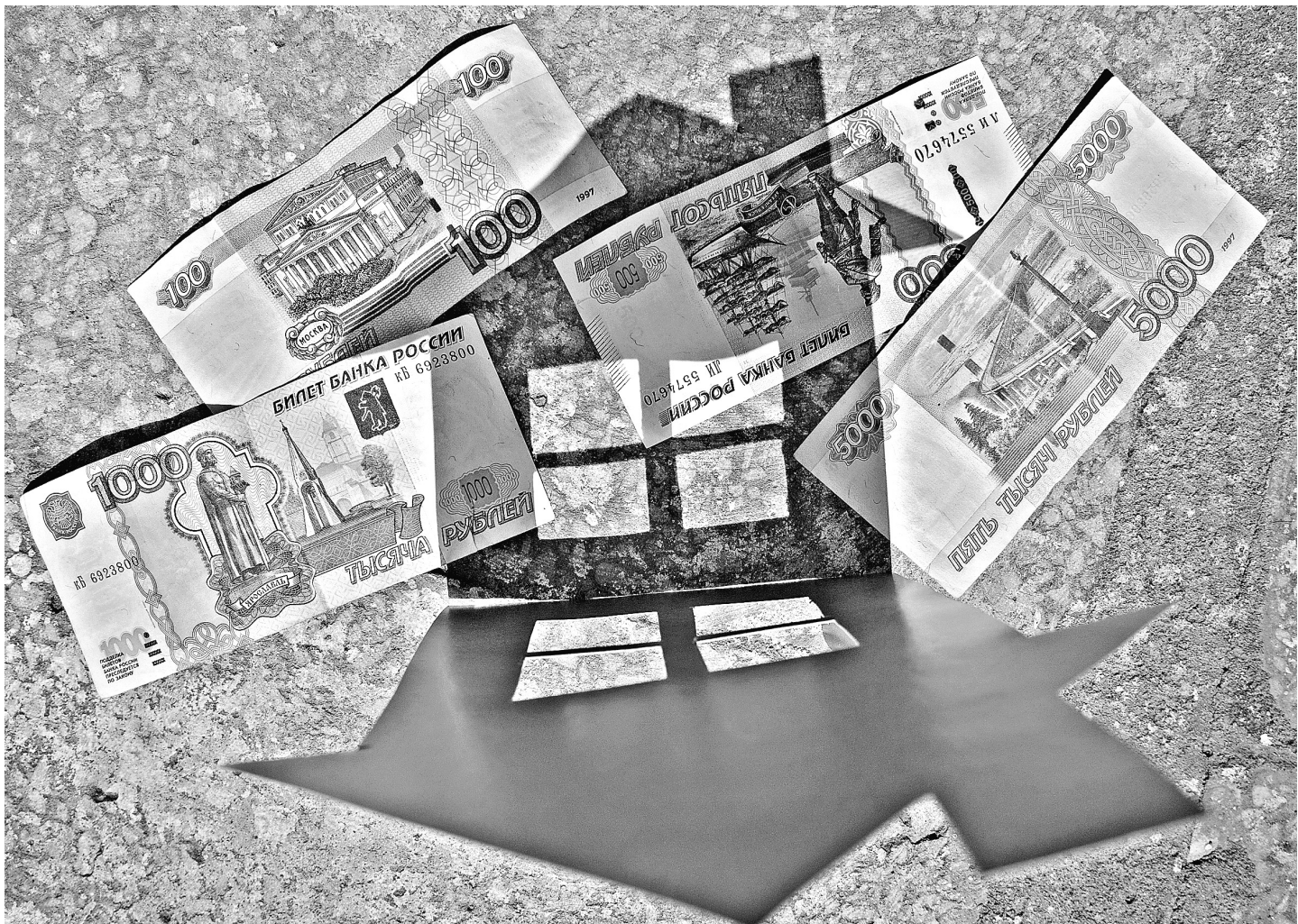
Если вы думаете, что и в этом году вам удастся спрятать свой дом «в тени» и не платить налог, то очень ошибаетесь. Вступил в силу закон, который обязывает собственников самостоятельно заявлять в налоговую инспекцию о своем доме. Это касается не только квартир, дач и других построек, но и личного автотранспорта. Не заявите — придется платить штрафы. И немалые!

Цены на соцслужбы регионы тоже будут устанавливать сами. Но высокими они быть не должны. А для отдельных категорий льготников предусмотрены «скидки».