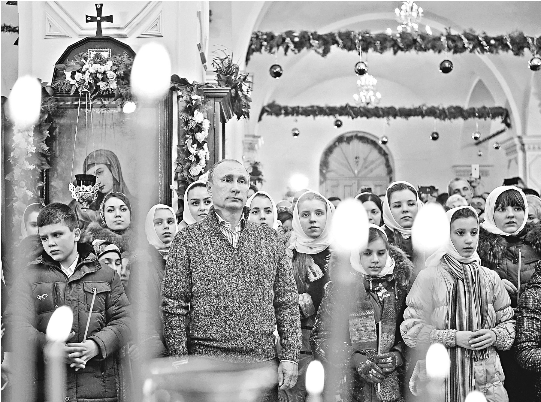
Владимир Путин присутствовал на рождественском богослужении в храме под Воронежем.

Смотрите фоторепортаж на сайте: www.rg.ru/ru/1069415