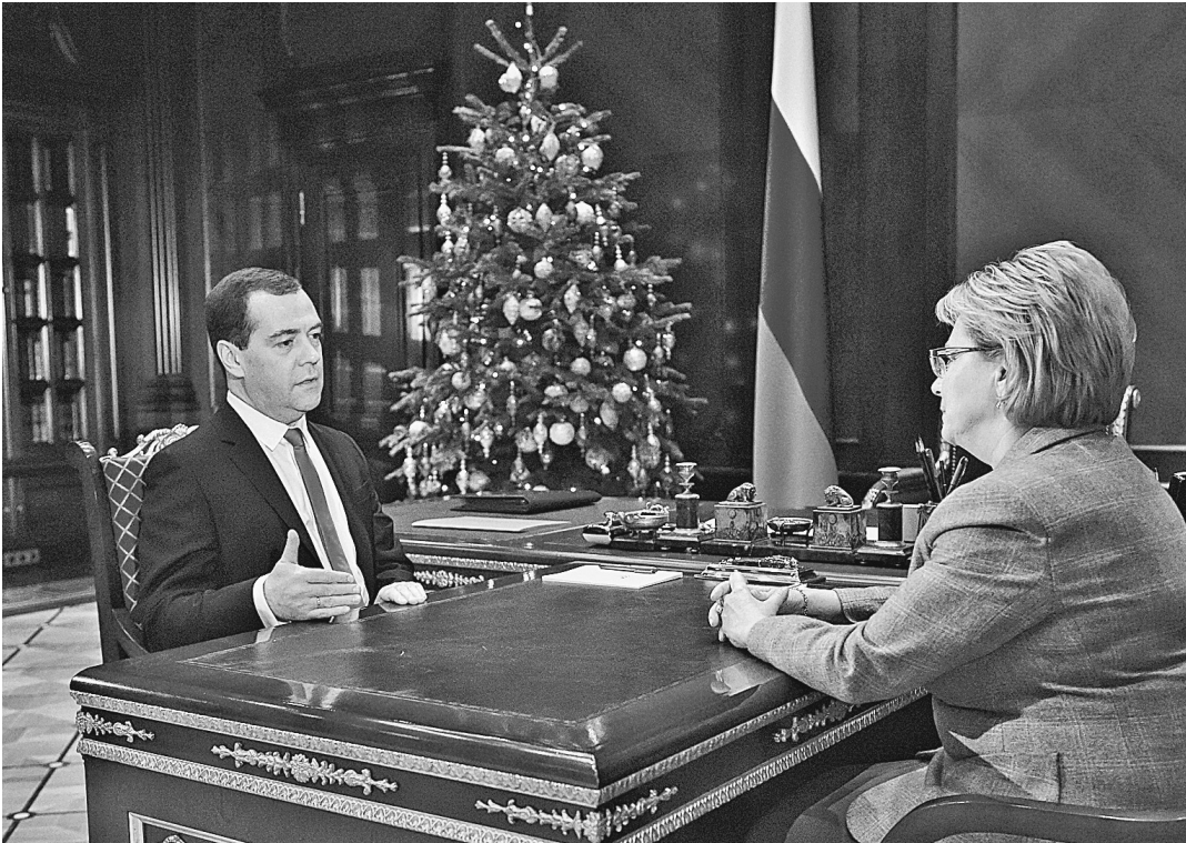
Дмитрий Медведев попросил Веронику Скворцову держать под контролем ситуацию с лекарствами.

Премьер попросил, как говорится, держать руку на пульсе и продолжать ритмично поддерживать запасы лекарств на нужном уровне. «Нужно его восполнять, как только возникает необходимость, проводить новые конкурсы, покупать новые препараты», — указал Медведев.