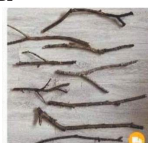
Руки для снеговика

Кроме того, в продаже в онлайн-магазинах набирает популярность так называемая «бытовая мишура»: елочные игрушки в виде предметов, которые нас окружают. Среди востребованных замечены