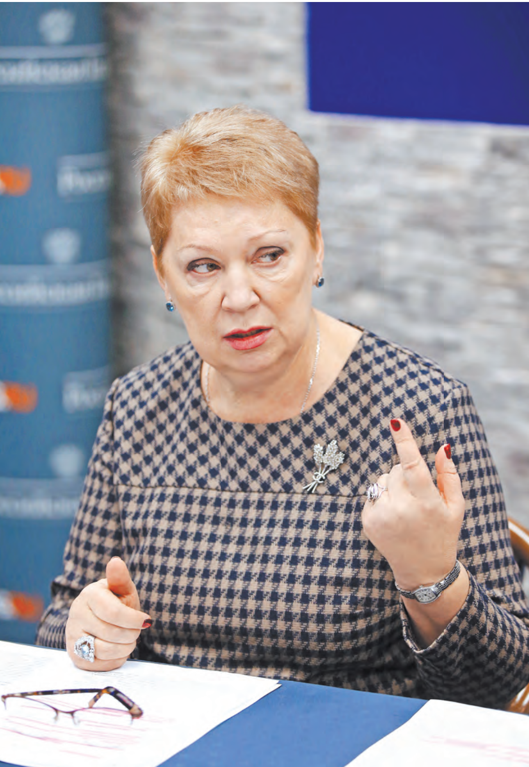
Ольга Васильева: Нам нужно восстанавливать то лучшее, чем отличалась советская система образования.

Ольга Васильева: Школы во многом автономны. Вопрос содержания домашних заданий, их объема — это ответственность конкретной образовательной организации и конкретного педагога. Однако предельная нагрузка на ребенка строго регламентирована: в первом классе домашнее задание не задают, во 2–3-х классах школьник не должен тратить на него больше полутора часов, в 4–5-х классах допускается максимум два часа, в 6–8-х — 2,5 часа, в 9–11-х — до 3,5 часов. Учителя эти нормы прекрасно знают и должны на них ориентироваться. Но проблема еще и в том, что