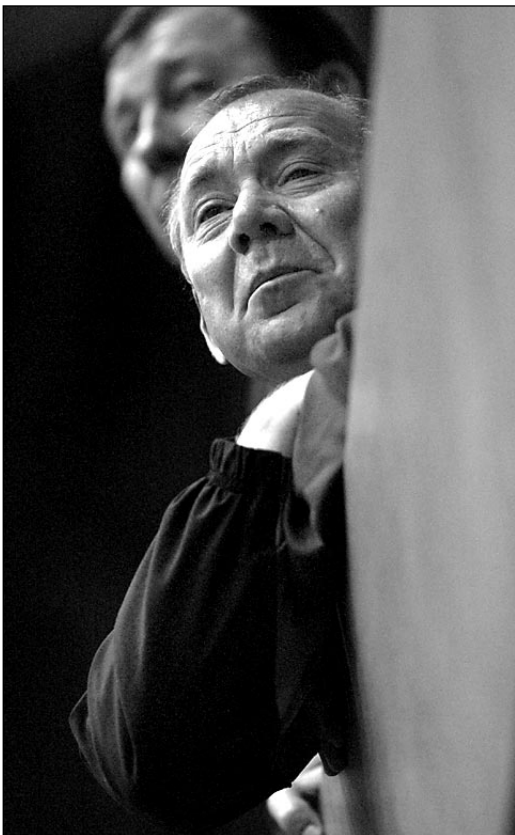
Вчера, Москва. Сокольники. Олег РОМАНЦЕВ.

— Рассчитываю на него как на хорошего, перспективного футболиста. Что касается позиций,