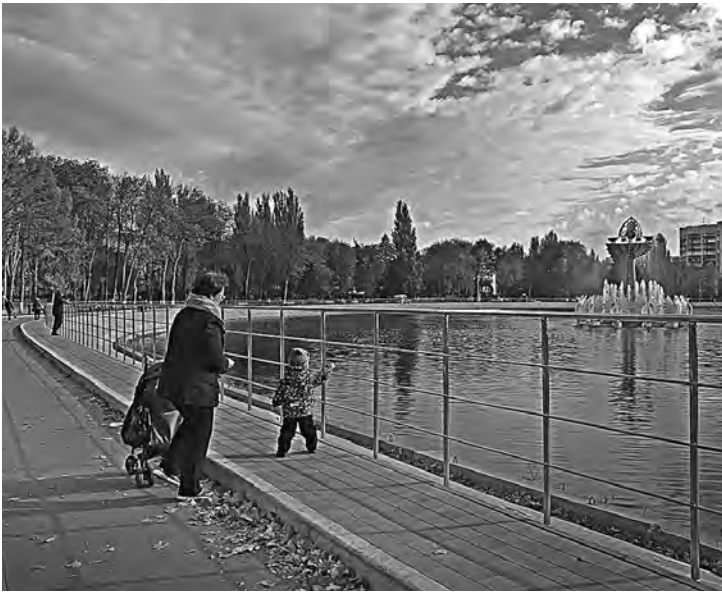
Фонтан в центре озера после реконструкции получил вторую жизнь.

Парк металлургов пытались открыть после ремонта раньше, но в апреле 2018-го плитка на пешеходных дорожках после схождения снега пошла «волнами». Поэтому покрытие дорожек переделывали по гарантии, а зону отдыха пришлось закрыть для посетителей.