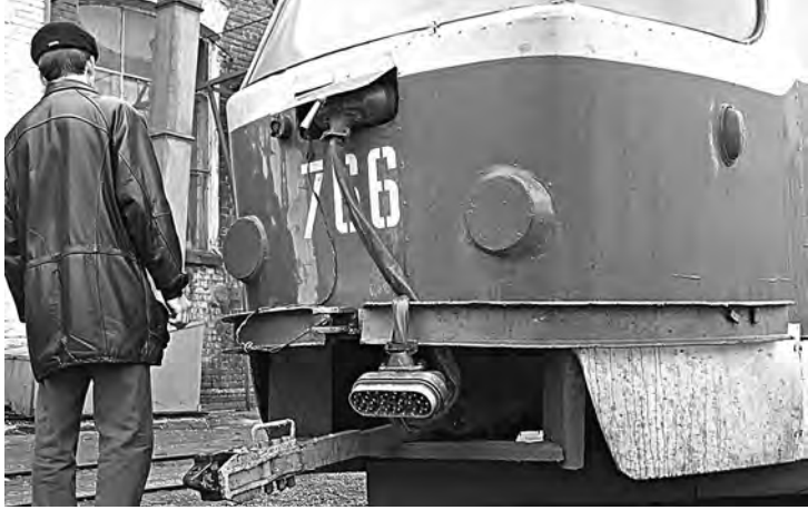
Остановка трамваев привела бы к транспортному коллапсу в городе.

Для города с населением 235 тысяч человек этот шаг обернется коллапсом. Только трамваев на балансе «Орскгортранса» значится 30. По улицам города курсируют также автобусы и