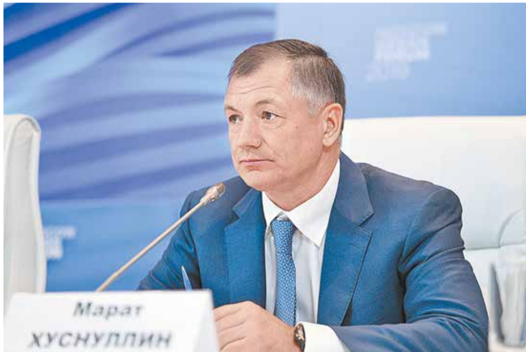
Заместитель председателя правительства РФ Марат Хуснуллин

Главными задачами нового кабинета станут развитие экономики и повышение благосостояния граждан