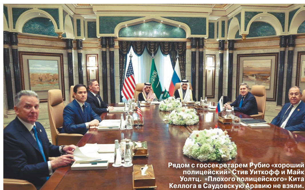
Рядом с госсекретарем Рубио «хороший полицейский» Стив Уиткофф и Майк Уолтц. «Плохой полицейский» Кита Келлога в Саудовскую Аравию не везли.

Майк УОЛТЦ: «Лучшего результата мы и представить себе не могли»