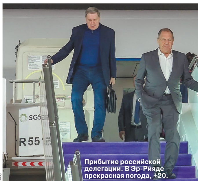
Прибытие российской делегации. В Эр-Рияде прекрасная погода, +20.