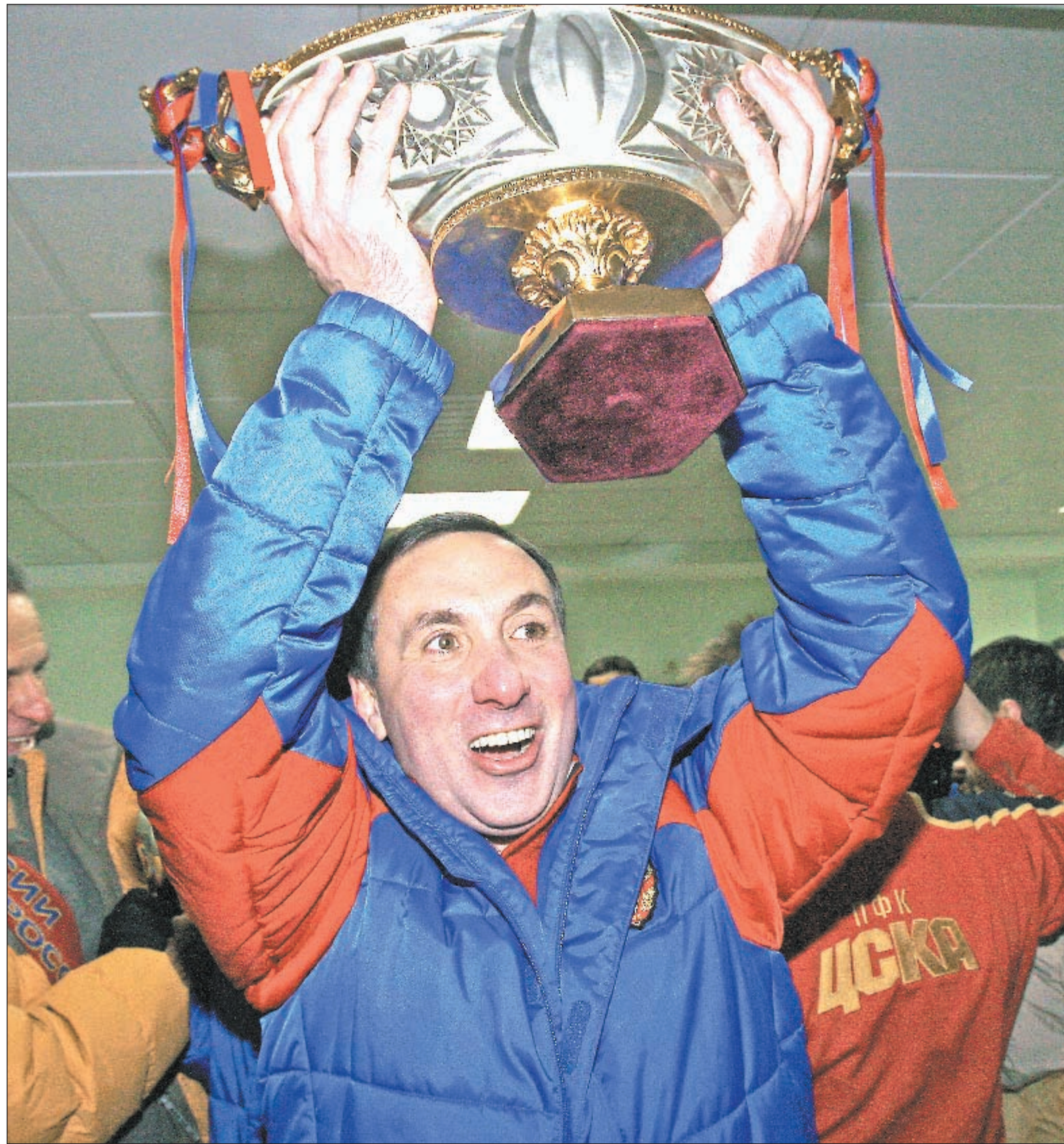
7 марта 2009 года. Москва. «Рубин» - ЦСКА - 1:2. Евгений ГИНЕР с трофеем за победу в Суперкубке России.

Большое эксклюзивное интервью президента ЦСКА. Его клуб сегодня проведет ответный матч 3-го отборочного раунда Лиги чемпионов с греческим АЕК.