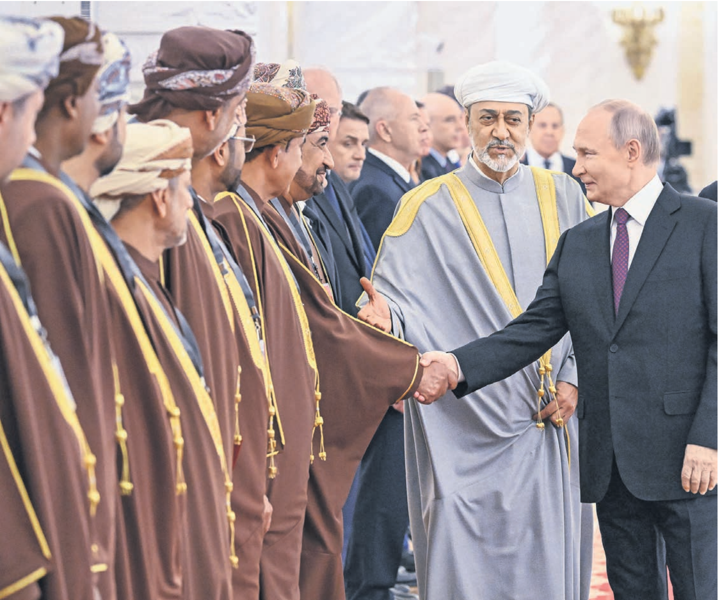
Президент России и султан Омана на осмотре

ве, а обе делегации отправились из Георгиевского зала к другим дверям, сразу поближе к обеду. — Ваше Величество, вы хорошо известны в России, — предупредил султана Омана Владимир Путин. — Вы неоднократно бывали в стране. Более того, в 1985 году именно вы поставили свою подпись под Соглашением об установлении дипломатических отношений между нашими странами (будущий министром. — А. К.). И в этом году мы будем отмечать 40-летие наших дипломатических связей. Да, Владимир Путин тогда еще работал в Дрездене. Думали ли он, простой питерский парень... — По линии министерств иностранных дел — информация проходила наверняка — мы планируем провести в этом году саммит между Россией и арабскими странами, — добавил господин Путин. То есть сам он участвовать не планирует.