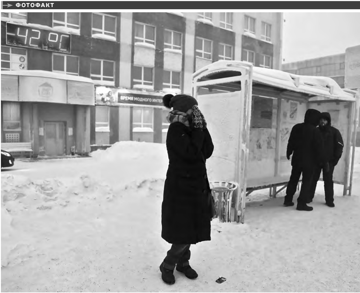
В Восточной Сибири уже неделю стоят крещенские морозы. Все предприятия и службы жизнеобеспечения — энергетики, ЖКХ, транспортники — переведены на усиленный режим. Люди выдерживают, однако лютый холод выводит из строя технику и коммуникации. Так, в Красноярске иногда с маршрутов сходит более трети автобусов — перемерзают механизмы закрывания дверей, замерзает дизтопливо, и даже приборы для считывания транспортных карт не работают из-за холода.

В ТУВЕ продлен срок приема заявок на благоустройство общественных пространств республиканской столицы. Предложения от активных горожан, учреждений, волонтерских организаций и молодежных объединений принимаются в департаменте архитектуры, градостроительства и земельных отношений мэрии. После создания дизайн-проектов предложений начнется голосование.