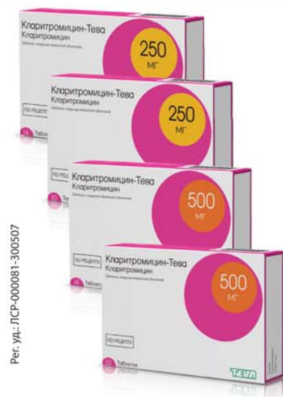
Табл. 250 мг № 10, № 14 Табл. 500 мг № 10, № 14