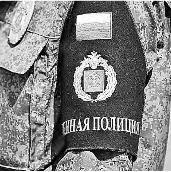
Солдат и офицеров с такану нашивкой на рукаве уже хорошо знают в военных гарнизонах.

Армейских полицейских закон наделит правом в строго оговоренных случаях применять физическую силу, специальные средства и огнестрельное оружие. А вот чем они точно заниматься не будут — так это гоняться за преступниками закон солдатами и офицерами. Действующий закон об оперативно-разыскной деятельности никто корректировать не собирается. Зато к важнейшей функции военной полиции отнесена борьба с дедовщиной и воровством армейского имущества.