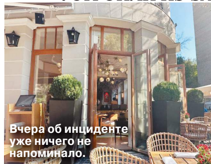
Вчера об инциденте уже ничего не напоминало.

Нешуточный переполох вызвала стрельба в самом центре Москвы, на Патриарших прудах в воскресенье вечером. Конфликт в ресторане «Аист» начался из-за предствительниц прекрасного пола. Как стало известно «МК», зачинщиком скандала стал уроженец Дагестана, который выпил лишнего и начал приставать к другим отдыхающим. Его попытались утихомирить гости питейного заведения из другой компании, затем в дело вмешались гости от еще одного столика. Кавказца попытались побить, после чего его приятель,