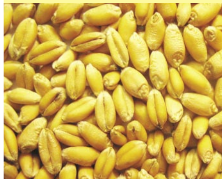
Качество зерна как инструмент управления ценами