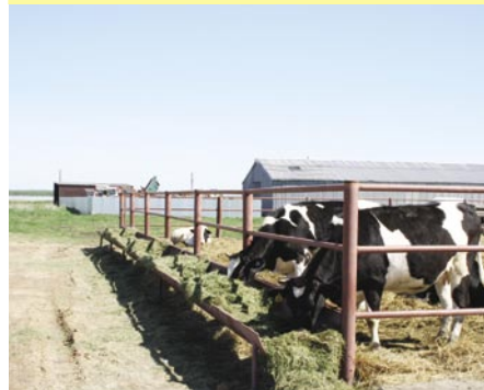
Страхование залогов при кредитовании агропредприятий и фермерских хозяйств