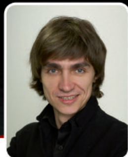
Сергей Филин, Художественный руководитель балета Большого Театра