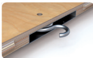
быстрая и эффективная сборка

Балетный пол нового поколения. Разрабатывался при участии врачей ортопедов, снижает риск травм и обеспечивает танцовщикам максимальный комфорт во время выступления.