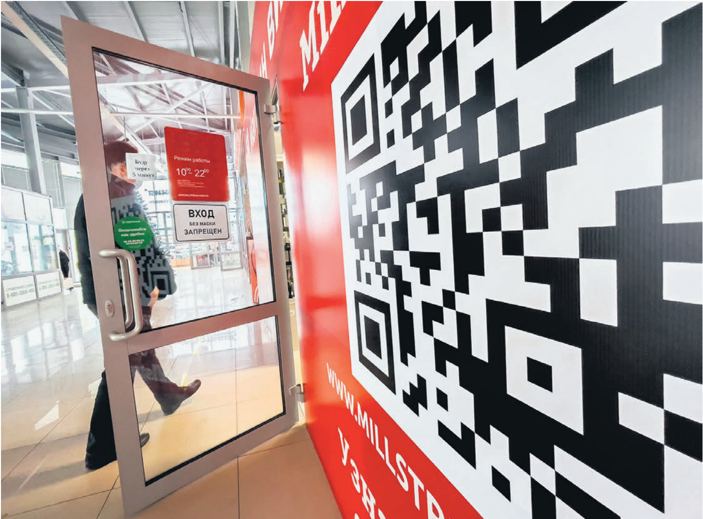
Технология QR-кода открывает перед некоторыми банками широкие комиссионные перспективы

Консорциум банков противопоставляет свой QR (на базе сервиса MultiQR от Сбербанка) единому QR-коду от ЦБ и НСПК. Ранее глава ЦБ Эльвира Набиуллина однозначно заявила, что QR будет только один и это будет QR от НСПК (см. „Ъ” от 28 сентября 2024 года). Более того, она предложила закрепить это законодательно, и соответствующий законопроект в прошлую пятницу был одобрен финансовым комитетом Госдумы.