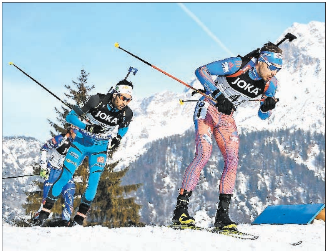
Четверг. Хохфильцен. Антон ШИПУЛИН (справа) и Мартен ФУРКАД во время смешанной эстафеты.

В четверг в ходе смешанной эстафеты лидер общего зачета Кубка мира Мартен Фуркад совершил несколько недружественных поступков в отношении биатлонистов сборной России. В ответ Александр Логинов и Антон Шипулин не пожалели французу руку на церемонии награждения и жестко высказались в его адрес на пресс-конференции. Тем не менее главный тренер нашей команды считает, что в ближайшее время соперники должны помириться.