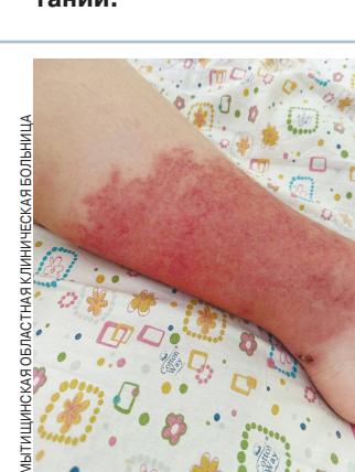
МЫТИЩИНСКИЙ ВОДОПРОВОД.

улице. Как сообщили правоохранителям родители погибшей, старшая дочь отличалась неспокойным характером, а все неудачи и переживания пропускала через себя с двойной силой. Выпускать негатив ей помогали фантазийная живопись и поддержка родителей, которые специально консультировались с психологом о ее воспитании.