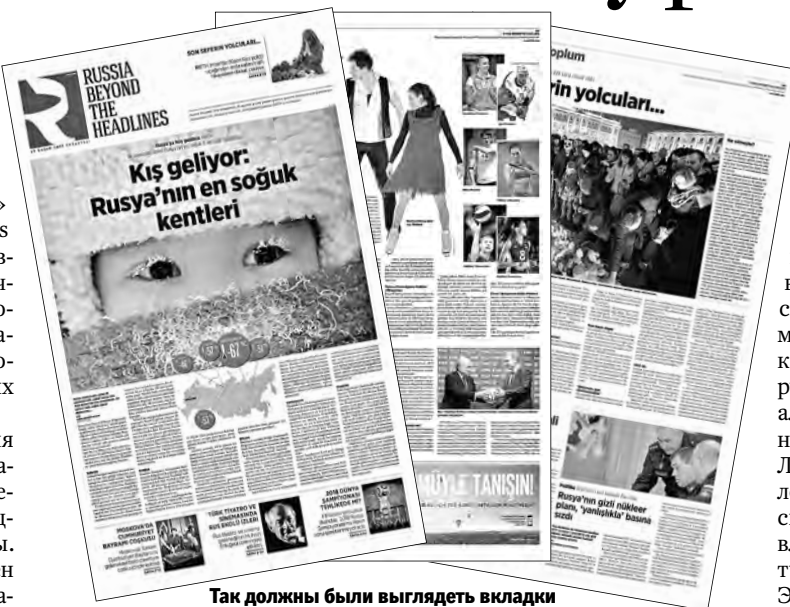
Так должны были выглядеть вкладыши RBTH в России для турецких СМИ.

Первый номер RBTH Турция готовился несколько недель, работе над номером были привлечены профессиональные турецкие журналисты и редакторы. Первый турецкий выпуск должен был познакомить турецких читателей с различными сторонами