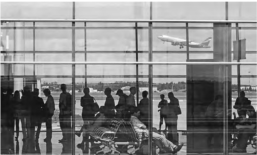
Тем, кто спонтанно решил в конце лета попутешествовать на самолете, дешевых билетов может не достаться.

Печальный многолетний опыт, когда конец августа превращается в сплошные мучения для отпускников и школьников, возвращающихся с отдыха домой, подсказал тему для коллективного репортажа корреспондентов «Российской газеты». Росавиация отправила авиакомпаниям и аэропортам телеграмму с напоминанием о грядущей «горячей» неделе. Дешевых билетов на ближайшие даты, увы, нет, так как в системах продаж билетов и в авиации, и на железной дороге действует принцип динамического ценообразования: чем больше спрос и ближе дата отправления, тем выше цена. Скидки и акции распространяются только на низкий сезон, например, на железной дороге с 40-процентной скидкой можно купить билеты в ряд поездов дальнего следования на даты с 1 октября по 21 декаб-