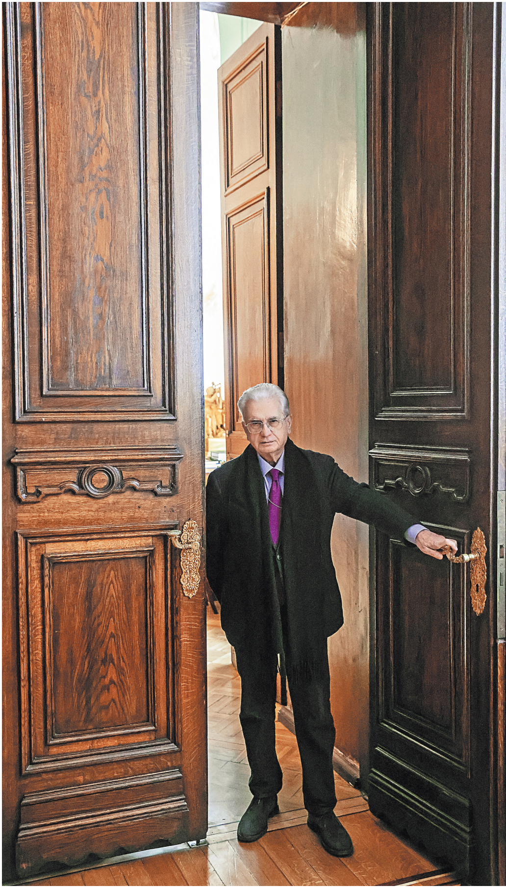
Михаил Пиотровский: Каждая выставка готовится в напряженной обстановке. Мы смотрим друг на друга, стараемся быть не хуже других, но при этом сохранять себя. Сейчас очень важно, кто и как влияет на музейную жизнь.

МИХАИЛ ПИОТРОВСКИЙ: Сейчас крайне нелегко сказать... Мы все-таки считаем, что выставки — а у Эрмитажа в 2024 году их было 46! — это не самое главное, что нужно музеям. Музеи не столько должны делать выставки, сколько собирать, хранить, реставрировать, изучать и показывать собственные коллекции. А временные выставки они для пиара, для денег, для удовольствия, но это что-то дополнительное. Когда ты уже рассказывал все свое. И в выставках есть какая-то ущербность: ты все время должен откуда-то что-то брать, как своего рода трофеи. И лучшие вещи вам никто никогда из музеев не даст. Сколько бы ни заявлялось — вот, мы собрали всего Пикассо! — нельзя собрать всего Пикассо. И тогда чтобы что-то получить, начинают шантажировать друг друга. Это хоть и интеллигентный, но немаленький бизнес, со своими договоренностями. А прекрасная художественная жизнь при этом превращается в жизнь магазинную, жизнь художественных лавок... 10 →