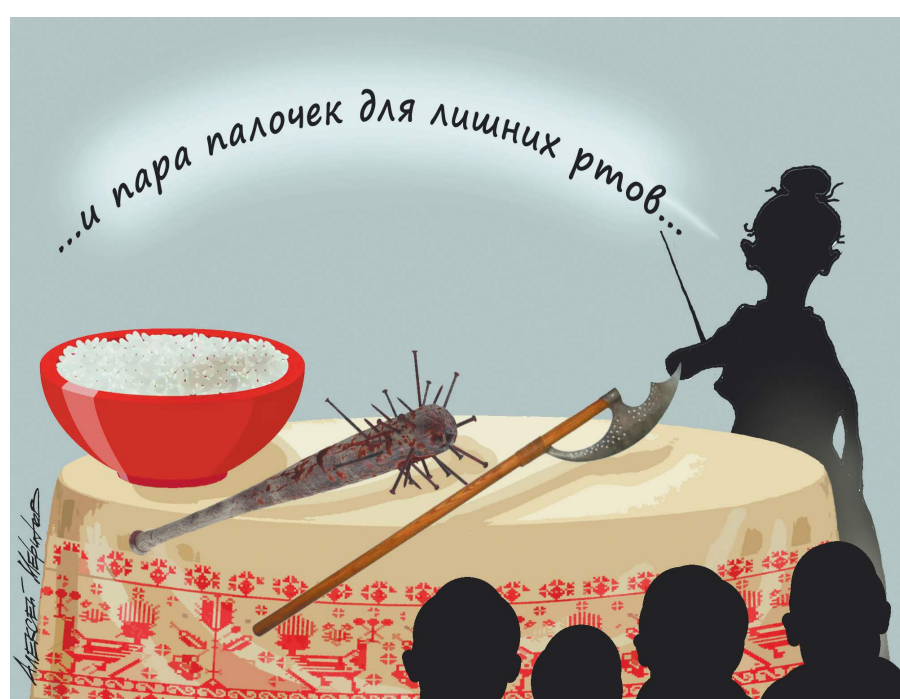
РИС В ЗОНЕ РИСКА

Крупы хотят оставить только для внутреннего потребления