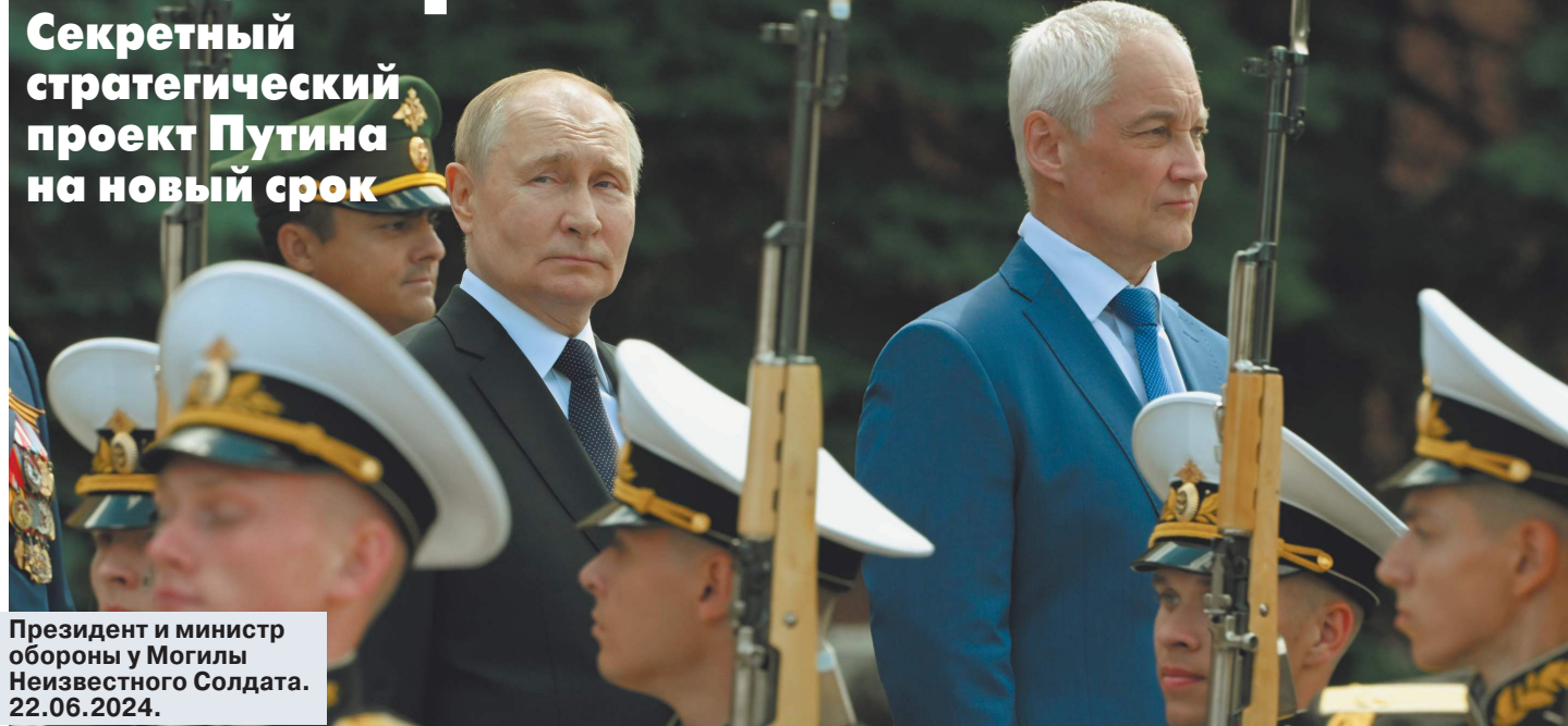
Президент и министр обороны у Могилы Неизвестного Солдата. 22.06.2024.

Секретный стратегический проект Путина на новый срок