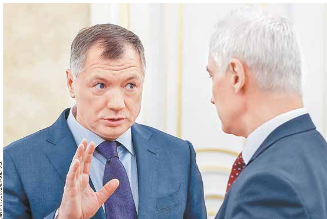
Вице-премьер правительства РФ Марат Хуснуллин (слева) с первым вице-премьером Андреем Белоусовым