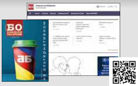
Ежемесячный деловой журнал www.bosfera.ru