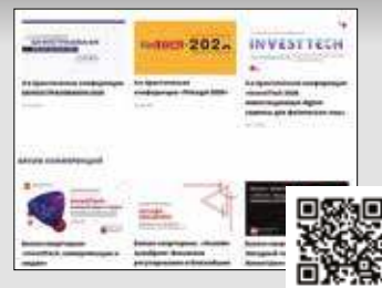
Конференции «Б.О» www.bosfera.ru/conference