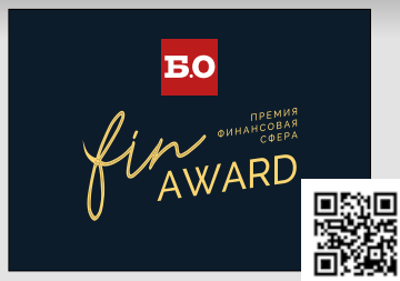
Премия инноваций и достижений финансовой отрасли www.finaward.ru