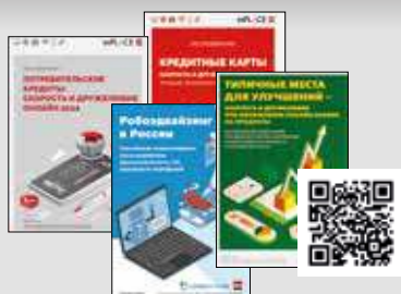
Исследования «Б.О» https://bosfera.ru/research