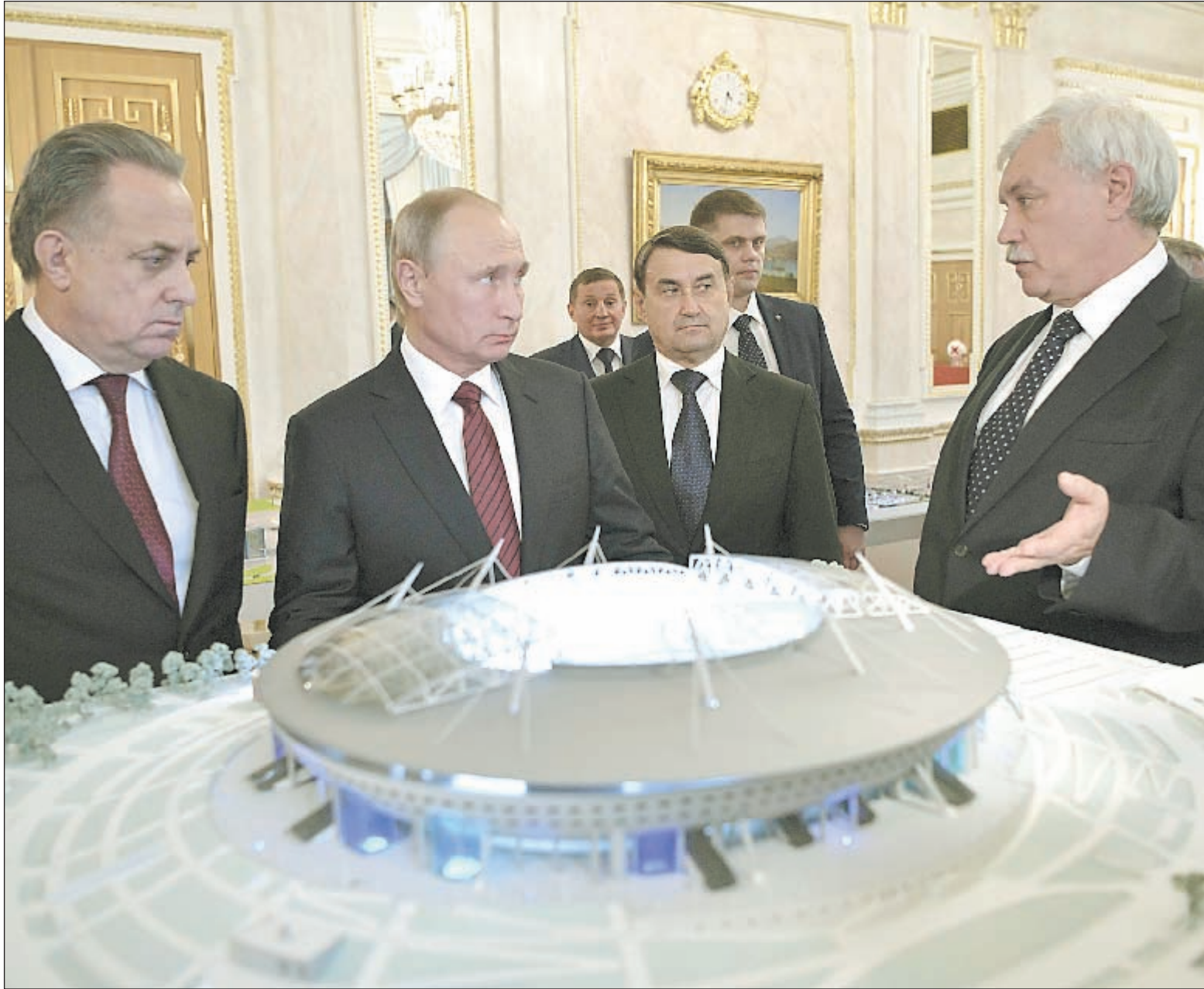
Вчера. Москва. Президент РФ Владимир ПУТИН, его помощник Игорь ЛЕВИТИН (второй справа), вице-премьер Виталий МУТКО (слева) и губернатор Санкт-Петербурга Георгий ПОЛТАВЧЕНКО (справа).

Президент «Зенита» после Совета по спорту дал интервью «СЭ»