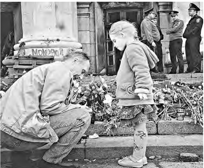
Сразу после трагических событий 2 мая одесситы несли цветы к Дому профсоюзов в память о погибших. Позже это место было «зачищено».

Он так же чужд веселой и беззаботной Одессе, как взрывающиеся снаряды на детской площадке. Прошло 100 дней после