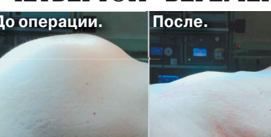
До операции. После.

Восьмью лет «вынашивала» свою миому 47-летняя женщина, пока опухоль не достигла пяти килограммов. Когда женщина поняла, что ей так же тяжело, как если бы она находилась на девятом месяце беременности, она решила обратиться к медикам. Как стало известно «МК», гинекологи больницы имени Ерамишанцева избавили пациентку от гигантского новообразования — в клинической практике миомы такого размера практически не встречаются. По словам пациентки, впервые у нее диагностировали эту опухоль в 2015 году, когда она забеременела третьим ребенком. Тогда миома была совсем небольшая и не мешала родам, а когда малыш появился на свет, женщина и вовсе забыла, что у нее есть на матке какое-то новообразование.