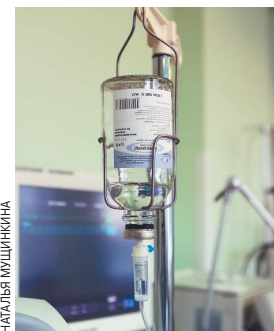
НАИЛА МАШИШВИНА ЕВГЕНИЙ СЕМЕНОВ