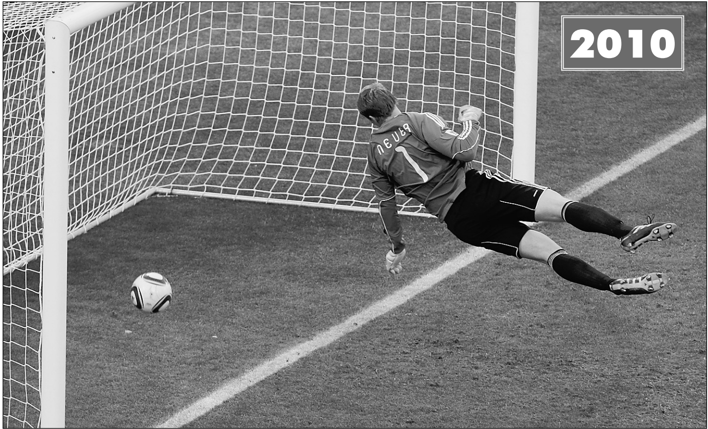
Если относительно гола, забитого англичанином Джеффом Херстом в ворота Ганса ТИЛКОВСКИ в финале ЧМ-1966, до сих пор ведутся споры, то мяч, побывавший вчера за спиной немца Мануэля НОЙЕРА после удара Фрэнка Лэмпарда, пересек линию ворот с огромным запасом.