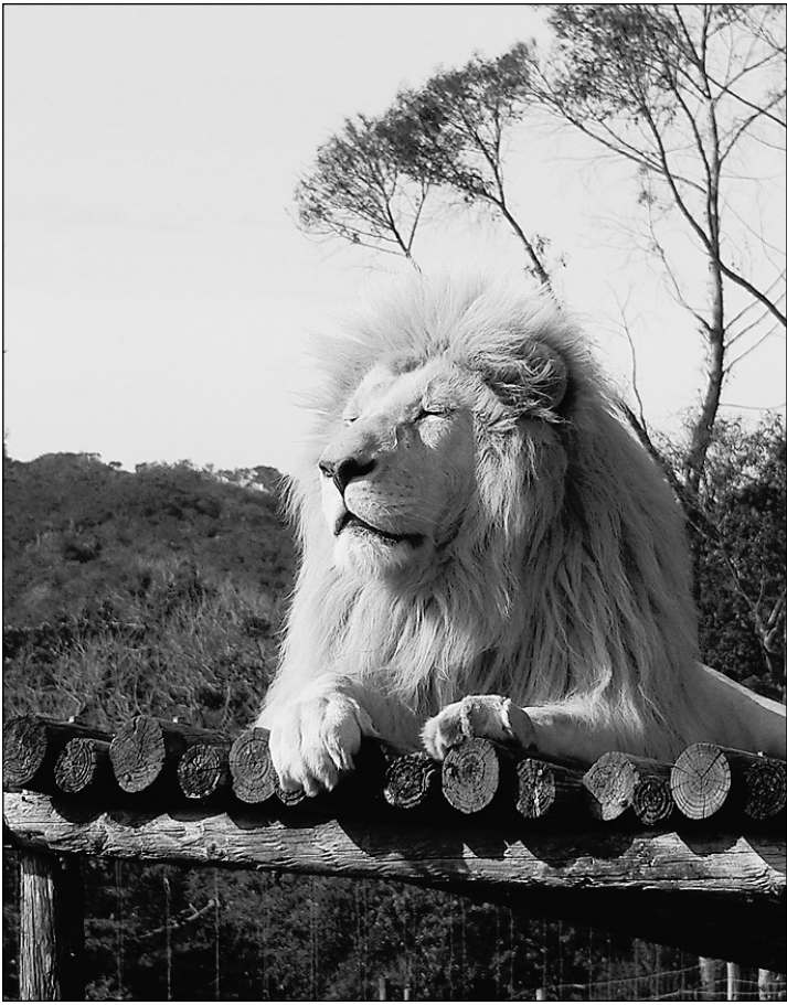
Южной Африке есть чем удивить гостей чемпионата мира. А чем Россия в случае успеха нашей заявки сможет восхитить болельщиков через 8 лет?