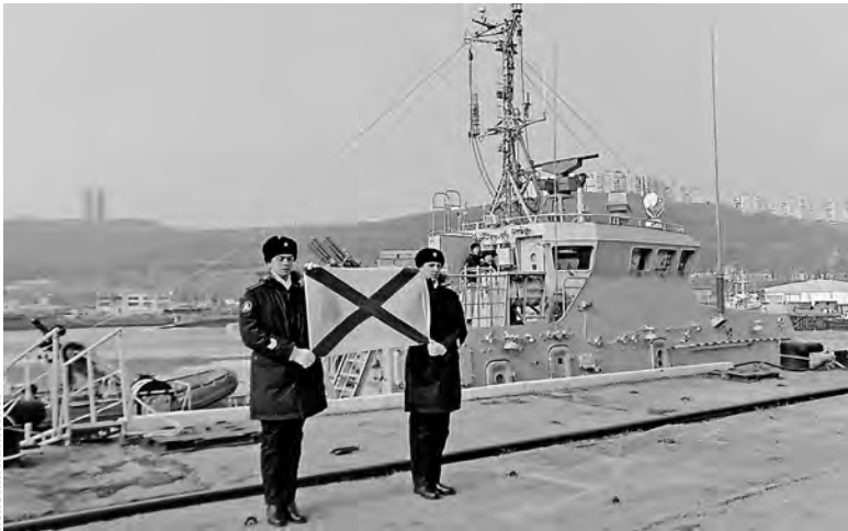
Андреевский флаг — в надежных руках тихоокеанцев.

→ СПРАВКА «РГ» Проект 21980 «Грачонок» разработали конструкторы ОАО «КБ «Вимпел» из Нижнего Новгорода.