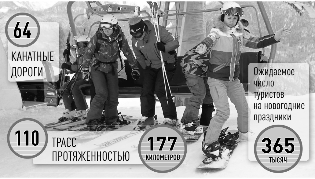
ИНФОГРАФИКА: РГ, ПАВЕЛ ВЕРМОНСКИЙ

— В этом году погода для горнолыжников, и трассы уже покрыты снегом. Горный кластер и средства размещения всех курортов готовы к приему гостей. Номерной фонд позволяет одновременно разместить более 15 тысяч человек. Пик посещаемости мы прогнозируем на новогодние праздники, поэтому будет увеличено количество рейсов «Ласточек» на курорты Сочи. Всего мы ждем более 365 тысяч гостей, загрузка отелей будет достигать ста процентов. Горнолыжные курорты смогут оценить и любители спорта, и те, кто приехал просто насладиться отдыхом в горах — на курортах для них подготовили множество мероприятий и фестивалей.